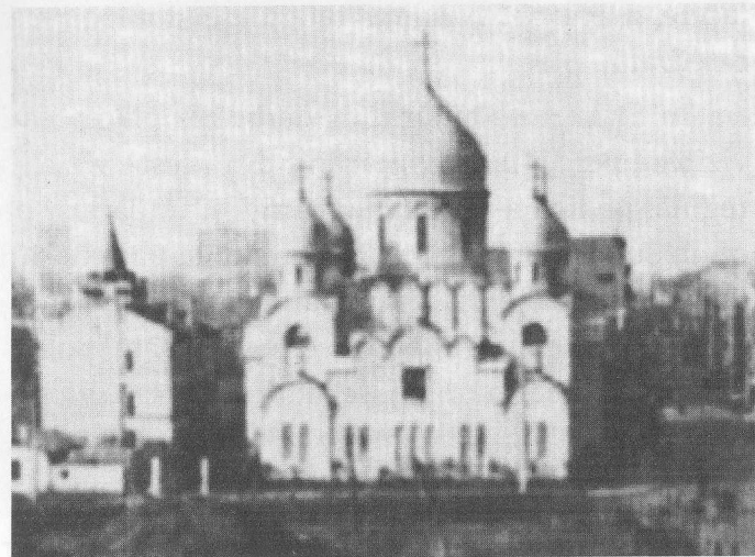
Catedrala din Shanghai construită de Sfântul Ioan Maximovici

În perioada anilor 1929-1934, a fost profesor la seminarul "Sfântul Ioan Botezătorul" din Bitola, iar în anul 1934 s-a luat hotărârea de a fi hirotonit la treapta de episcop. În ceea ce-l privește pe Părintele Ioan, nimic nu putea fi mai străin năzuințelor sale decât acest lucru. Un cunoscut povestește cum l-a întâlnit în acea vreme la Belgrad: Părintele i-a spus că se afla în oraș din greșală, chemat în locul unui oarecare Ieromonah Ioan, care urma să fie făcut Episcop. A doua zi, el i-a spus acelei persoane că s-a creat o situație și mai proastă decât crezuse: pe el vor să-l facă Episcop!