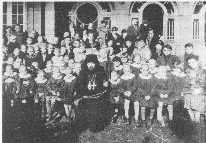
Sfântul Ioan Maximovici între copiii orfelinatului din Shanghai

Una dintre persoanele care-l însoțea a povestit despre o astfel de întâmplare: Vlădica Ioan a pornit pe străzile orașului, cumpărând o sticlă de băutură, s-a îndreptat către străzile periculoase ale mahalalelor. Această persoană a rămas nedumerită de la cele întâmplare: ce să facă un monah cu o sticlă de lichior? Vlădica s-a oprit lângă un container de gu-