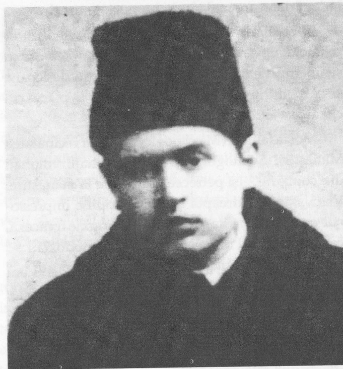
Tânărul Mihail Maximovici la vârsta de 15 ani

scriitor și poet duhovnicesc, luminător al Siberiei, care a trimis prima misiune ortodoxă în China și a săvârșit numeroase minuni. El a fost canonizat în 1916, iar Sfintele Sale Moaște se păstrează până în zilele noastre la Tobolsk. Cu toate că Sfântul Ierarh Ioan a murit la începutul secolului al XV-III-lea, duhul său a purces asupra urmașului său